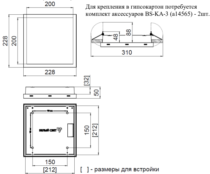
Рис. №2 Габаритный чертёж